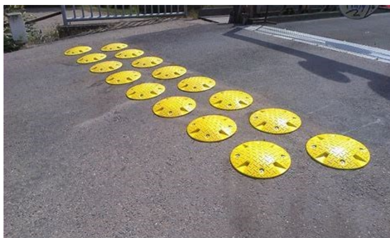
MČ Praha - Slivenec